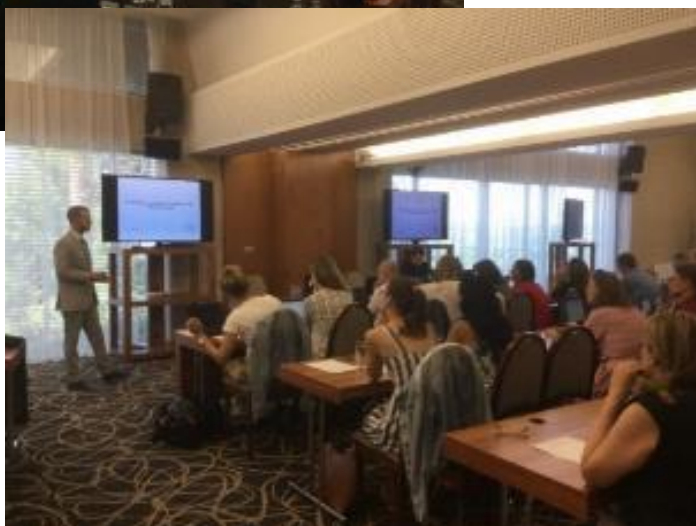
„Zmeny zákona o verejnom obstarávaní v roku 2022 a ich dopady“, 27. 06. 2022, účelové zariadenie ÚV SR Hotel Bôrik, Bratislava