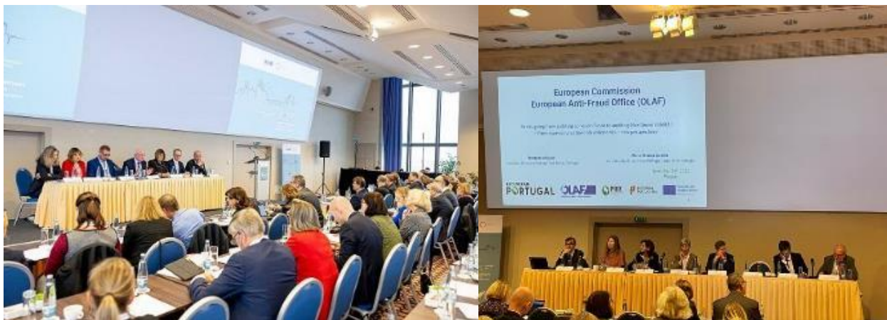
Konferencia EÚ: “Predchádzať - Odhaľovať - Vyšetrovať: Nové výzvy v boji proti podvodom a nezrovnalostiam vo výdavkovej oblasti”, Praha, dňa 23. 11. 2022 - 25. 11. 2022