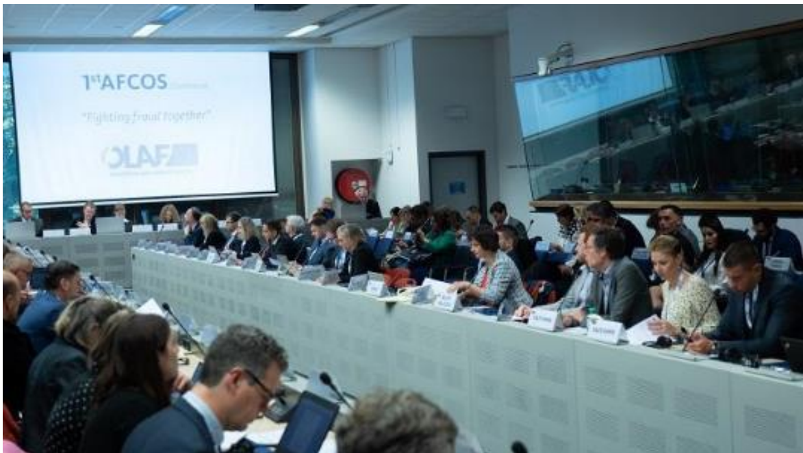
Zdroj: tlačová novinka OLAF zo dňa 06. 10. 2022

nedávne zmeny v oblasti boja proti podvodom na úrovni EÚ, oznamovanie nezrovnalostí a jeho význam pre prevenciu a odhaľovanie podvodov, národné stratégie boja proti podvodom, možnosti finančnej podpory OLAF-u pre vnútroštátne orgány, nástroje na analýzu informácií, výmena informácií a vzájomná podpora počas vyšetrovaní OLAF-u.