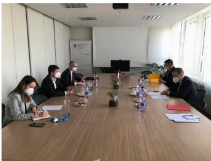
Predstavitelia PMÚ SR a ÚOHS počas pracovnej návštevy, 02. 02. 2022, Bratislava

V rámci ďalšieho rozvíjania bilaterálnej spolupráce s partnerským úradom na ochranu hospodárskej súťaže v Českej republike (ďalej len „ÚOHS“) predstavitelia PMÚ SR dňa 2. 2. 2022 privítali hostí z ÚOHS na pracovnej návšteve v Bratislave. Pre obe strany bola pracovná návšteva príležitosťou na podrobné prekonzultovanie viacerých aktuálnych výziev , ktorým v súčasnosti čelia obe inštitúcie a zároveň na zaujatie jednotného a čo najlepšieho postoja k riešeniu momentálnych otázok pri ochrane hospodárskej súťaže a presadzovaní jej princípov.